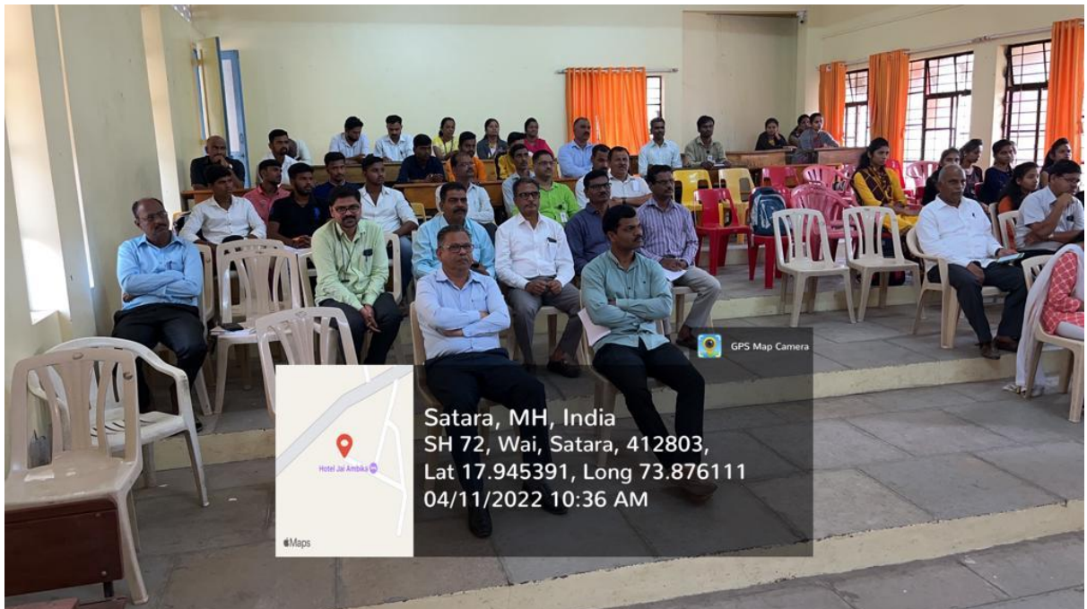
कार्यक्रमातील उपस्थिती अध्यापक व विद्यार्थीवृंद Attendance in the Programme Teachers and Students